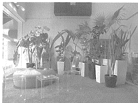
場所は養巴幼稚園西側の「シャトー赤坂」1階

観葉植物の企画・販売を手掛けるBAROQUE GREEN（福岡市中央区赤坂3丁目、上和田英夫社長）は12月1日、同所に観葉植物専門店「BAROQUE GREEN」をオープンした。 フロア面積は約83㎡。商談ブースを設けるほか、植物の設置場所を訪問し、空間や間取りに応じて商品を提案する。約百数十種類の植物を取り扱い、鉢はイタリアやドイツ製のデザインアズポットを