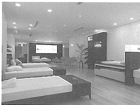
営業時間は午前11時から午後8時まで（水曜定休日）

枕、マットレス販売などのテンピュール・ジャパン(有)（神戸市中央区、キム・モーテンセン代表）は1月29日、福岡市中央区大名2丁目に九州初出店となるショールームをオープンした。 場所は福岡歯科衛生専門学校校東側、「Cecilio Daisy」1階。銀座に続く2店目のショールームで、九州地区の旗艦店として出店した。メインターゲットは30代。店舗面積は約181㎡。オープン記念として、博多ラメ